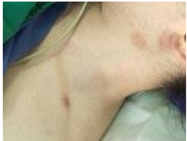
تصویر 1- هیپرپیگمانتاسیون ناشی از ضایعات پمفیگوس در ناحیه گردن و شانه

اورژانس به اتاق عمل منتقل شد. در شرح حال به عمل آمده سابقه هیچگونه حساسیت دارویی یا غذایی ذکر نشد. بیمار به علت پمفیگوس ولگاریس تحت درمان با پردنیزولون خوراکی 40 میلی‌گرم روزانه بود و مصرف داروی خاص دیگری را ذکر نمی‌کرد. به دلیل همراهی پمفیگوس با سایر بیماری‌های خودایمنی، شرح حال دقیقی از این موارد نیز اخذ شد. 7 بیمار در وضعیت فیزیکی کلاس 2 طبقه‌بندی انجمن متخصصین بیهوشی آمریکا قرار داشت. قد و وزن وی به ترتیب 160 سانتی‌متر و 64 کیلوگرم بود. در معاینه بالینی ناحیه تناسلی ضایعات زخمی شونده قرمز رنگ، در ناحیه زبان ضایعات تاولی و همچنین در ناحیه گردن و شانه، هیپرپیگمانتاسیون ناشی از ضایعات پمفیگوس قابل مشاهده بود (تصاویر 1 و 2).